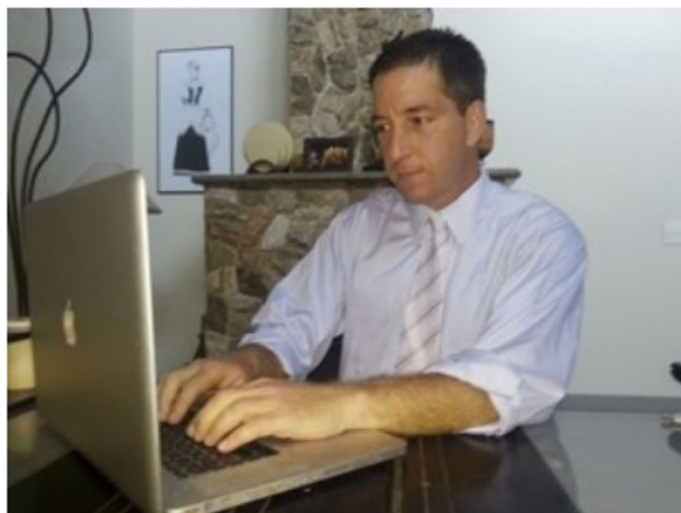
Colunista Glenn Greenwald

Os documentos em posse do ex-agente da CIA Edward Snowden contêm detalhes sobre como funciona o programa de espionagem da Agência de Segurança Nacional (NSA, na sigla em inglês), afirmou o repórter Glenn Greenwald, em entrevista à Associated Press.