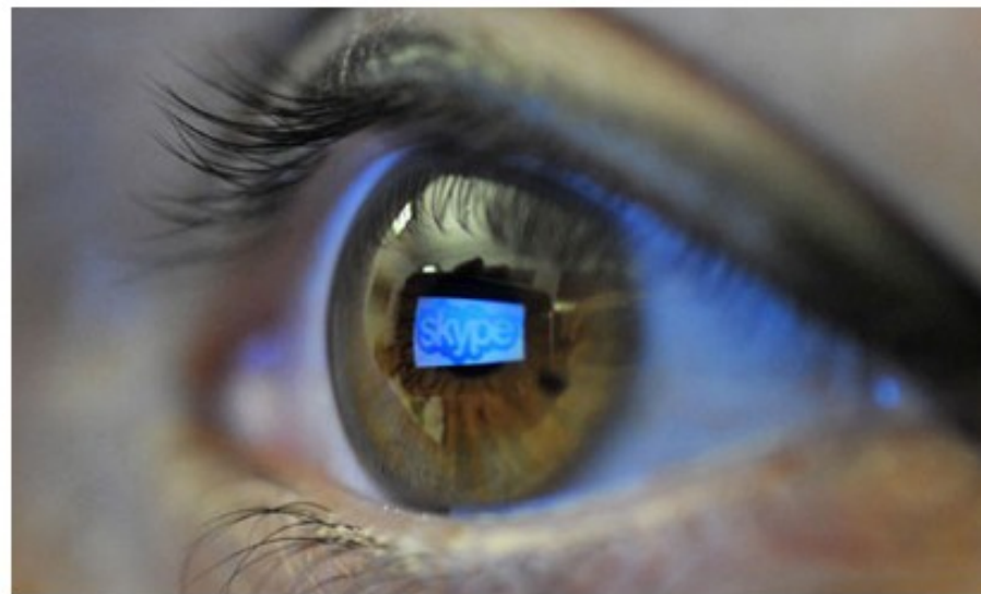
Skype worked with intelligence agencies last year to allow Prism to collect video and audio conversations.

Microsoft has collaborated closely with US intelligence services to allow users' communications to be intercepted, including helping the National